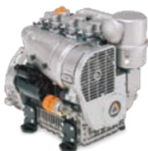
Diesel 3 cilindros