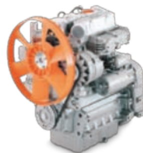
Diesel 3 cilindros