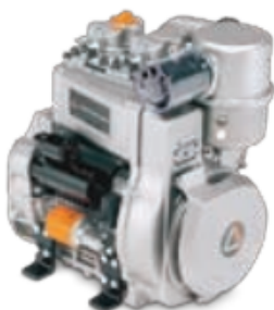
Diesel 2 cilindros

Esencial para perdurar en el tiempo con su transmisión que ha sido diseñada para garantizar la posibilidad de tener una relación adecuada para cada requisito de trabajo, mientras mantiene la simplicidad que lo convierte en una transmisión indestructible.